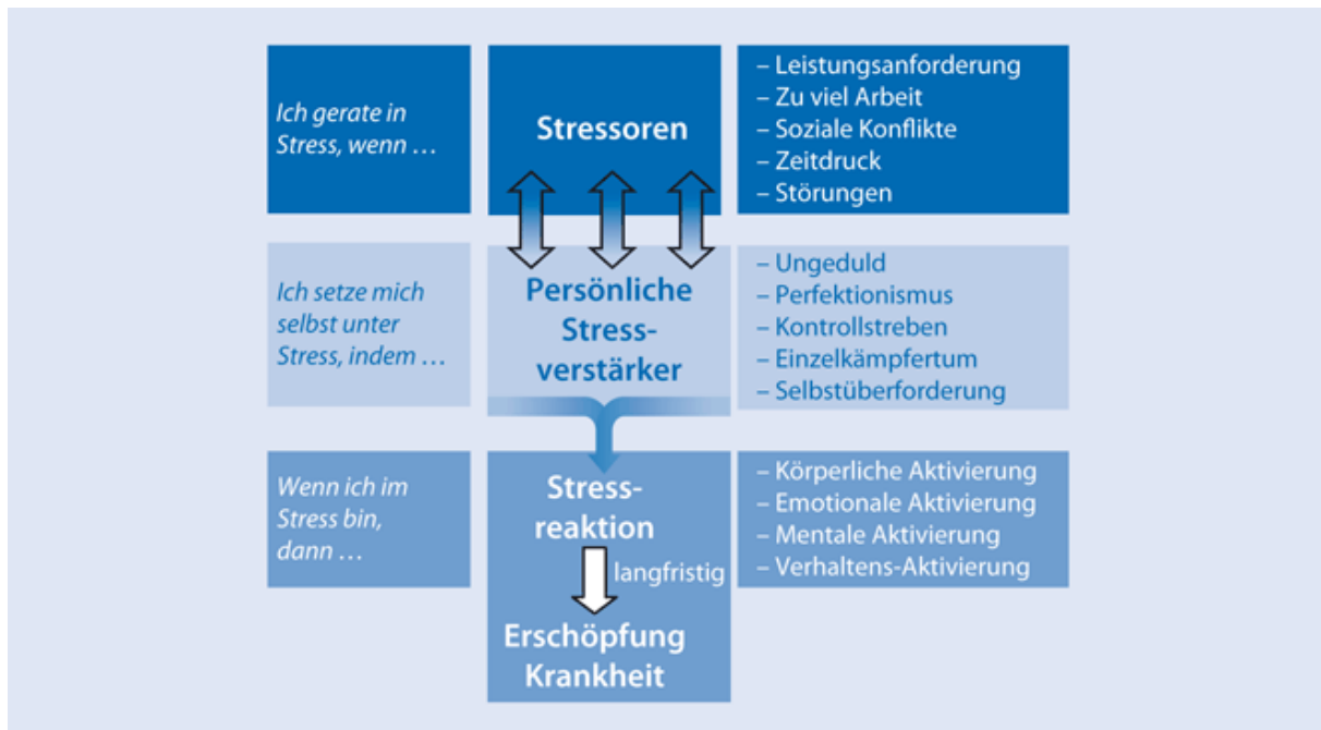
Abbildung 2: Die drei Ebenen des Stressgeschehens „Stress Ampel“ (Kaluza 2011, S.13)

Heutzutage umgeben uns viele unspezifische Stressoren (z.B. Straßen-, Fluglärm, Telefonklingeln oder Angst vor Arbeitsplatzverlust, hohe Arbeitsverdichtung, so dass immer, real oder gefühlt, etwas unerledigt bleibt; der Anspruch, perfekt zu sein oder alle Aufgaben sofort zu erledigen, überfordert, ebenso wie Schlafmangel oder zu viel Zeit vor den Medien), die den Körper unbewusst immer wieder aktivieren, aber nur latente Gefahrenquellen auslösen, ihn aber in ständiger Handlungsbereitschaft (Dauerstress) versetzen, ohne zu einer Bewegung oder gar Reinigung zu führen. Parallel dazu bewegen wir uns (über die letzten Jahrzehnte gesehen) immer weniger, brauchen im Alltag weniger Kraft (lindemann-coach.de).